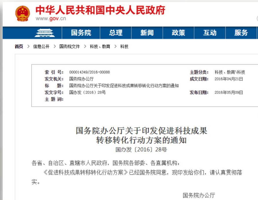
《中华人民共和国促进科技成果转化法》 (2015年8月29日 全国人大常委会修正)